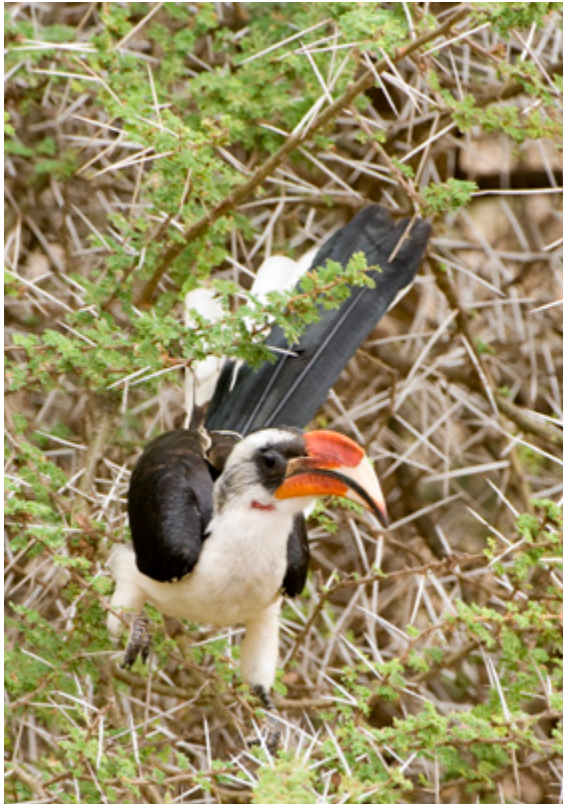
De heer en mevrouw Von der Decken's Hornbill