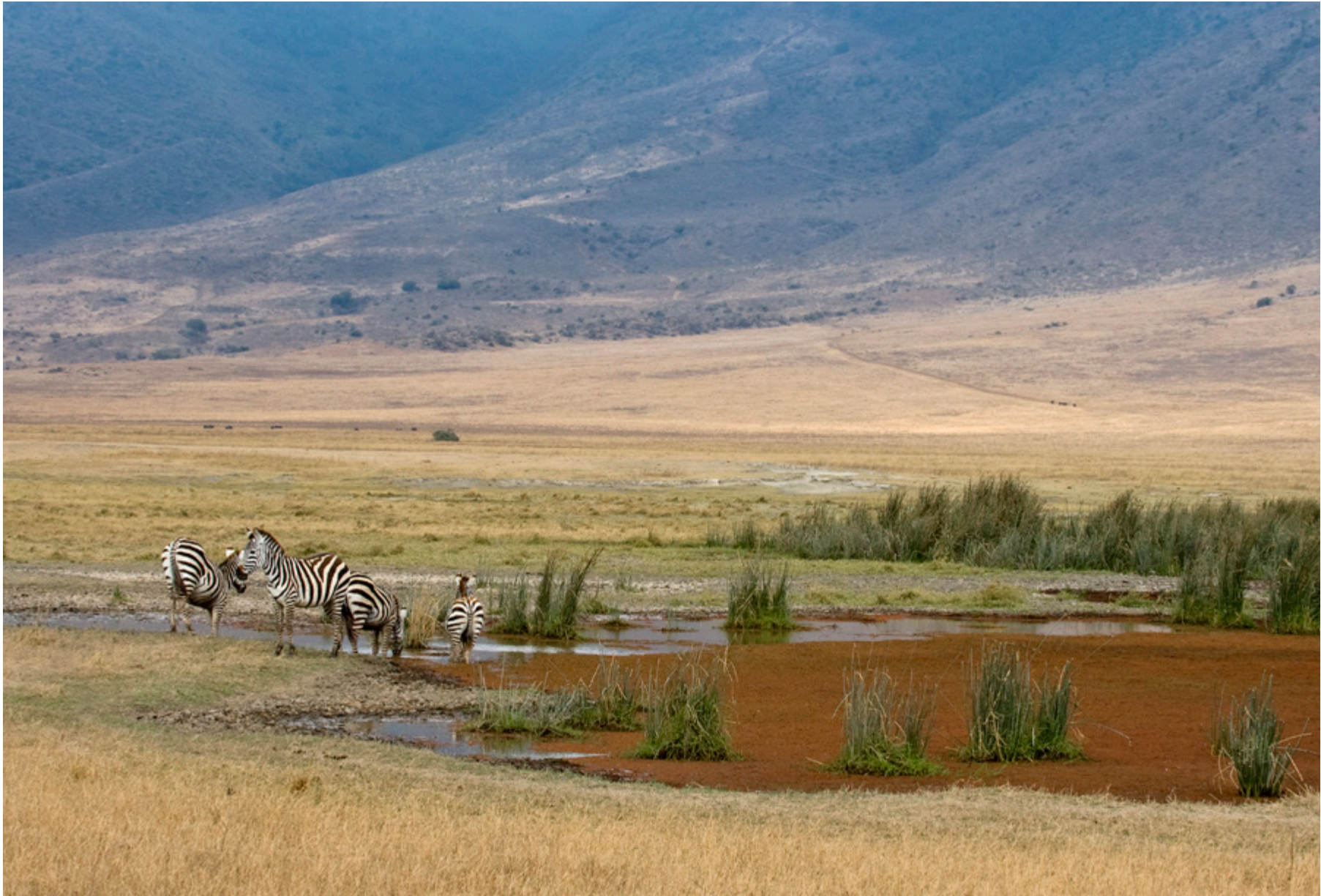
Een zeer bijzonder oord: de Ngorongoro krater.