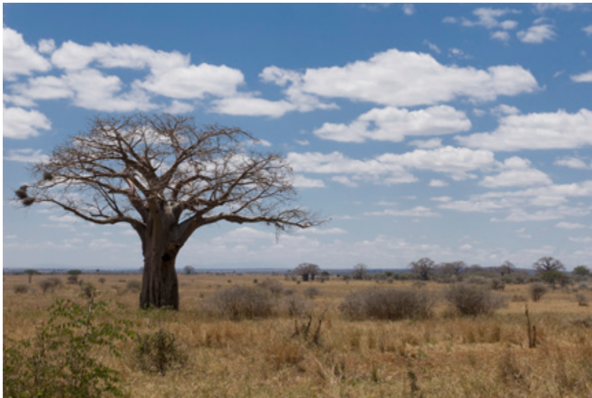
Baobabs in Tarangire National Parc

Dit 2600 km 2 tellende nationale park biedt één en al verrassing. Meteen al staan er olifanten, zebra's, impala's en wildebeesten. De eerste giraffe knikt ons toe, evenals een hamerkop. Een kleine drie uur rijden langs het nodige wild en talloze vogels staan we bij het Swala Camp. Bij dit kleinschalige exclusieve tented kamp is de ontvangst niet alleen allerhartelijkst maar ook met een nat doekje, om de bestofte gezichten en handen wat op te frissen, en een glas champagne. De tenten, met riante bedden en een badkamer ensuite, beschikken over een privé terras met uitzicht op de wildernis. De