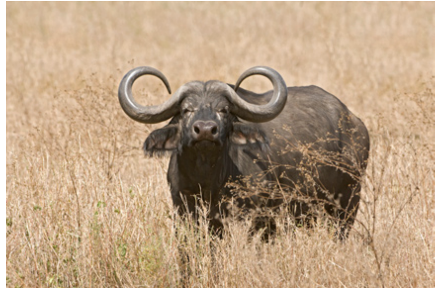
Fraai stel hoorns op deze buffel!