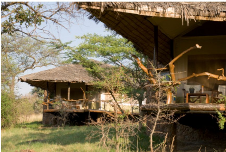
De chalets van de Mbalageti lodge...