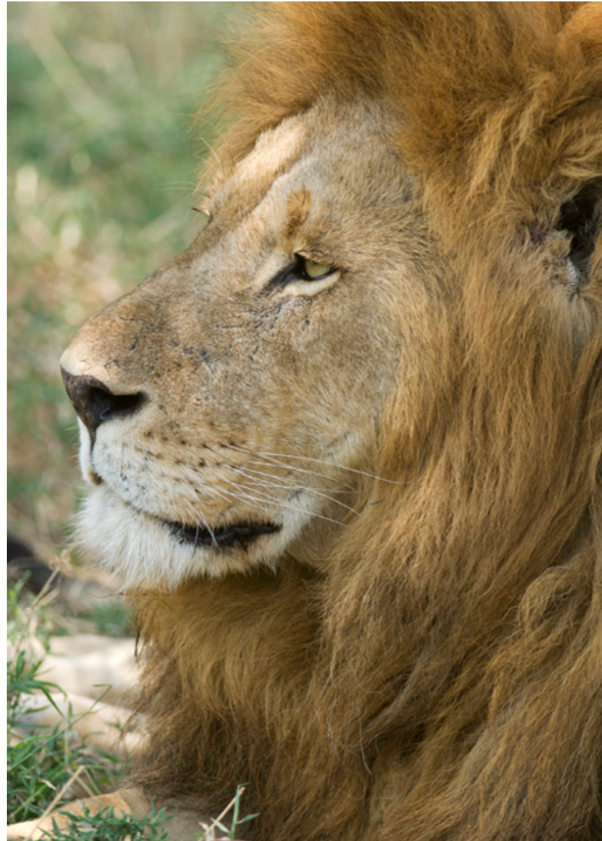
Een territorium moet regelmatig worden gemarkeerd.