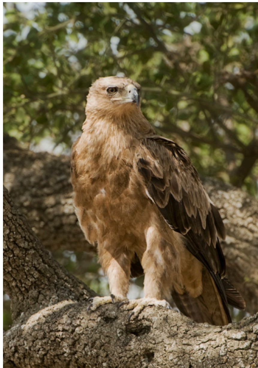
De Tawny Eagle.