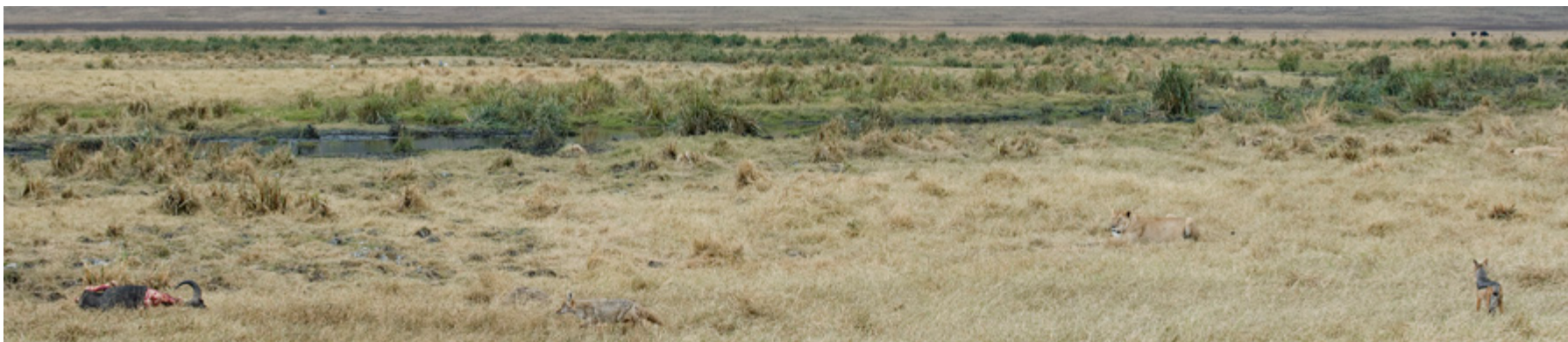
Schitterend kat-en-muisspel tussen de jakhalzen en de leeuwen in de Ngorongoro krater.

Tekst: Monique van Rijen-Bos / Foto's: Dick Bos