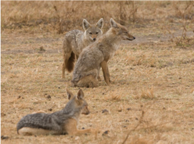
Twee Golden en een Black-backed jakhals.

E n zo geschiedde inderdaad op 1 september. Na een frisse nacht, waarbij we warme kruiken in bed vonden, rijden we de volgende ochtend de krater in. Buiten het prachtige schouwspel tussen jakhalsen en leeuwin, spotten we weer heel veel andere dieren.