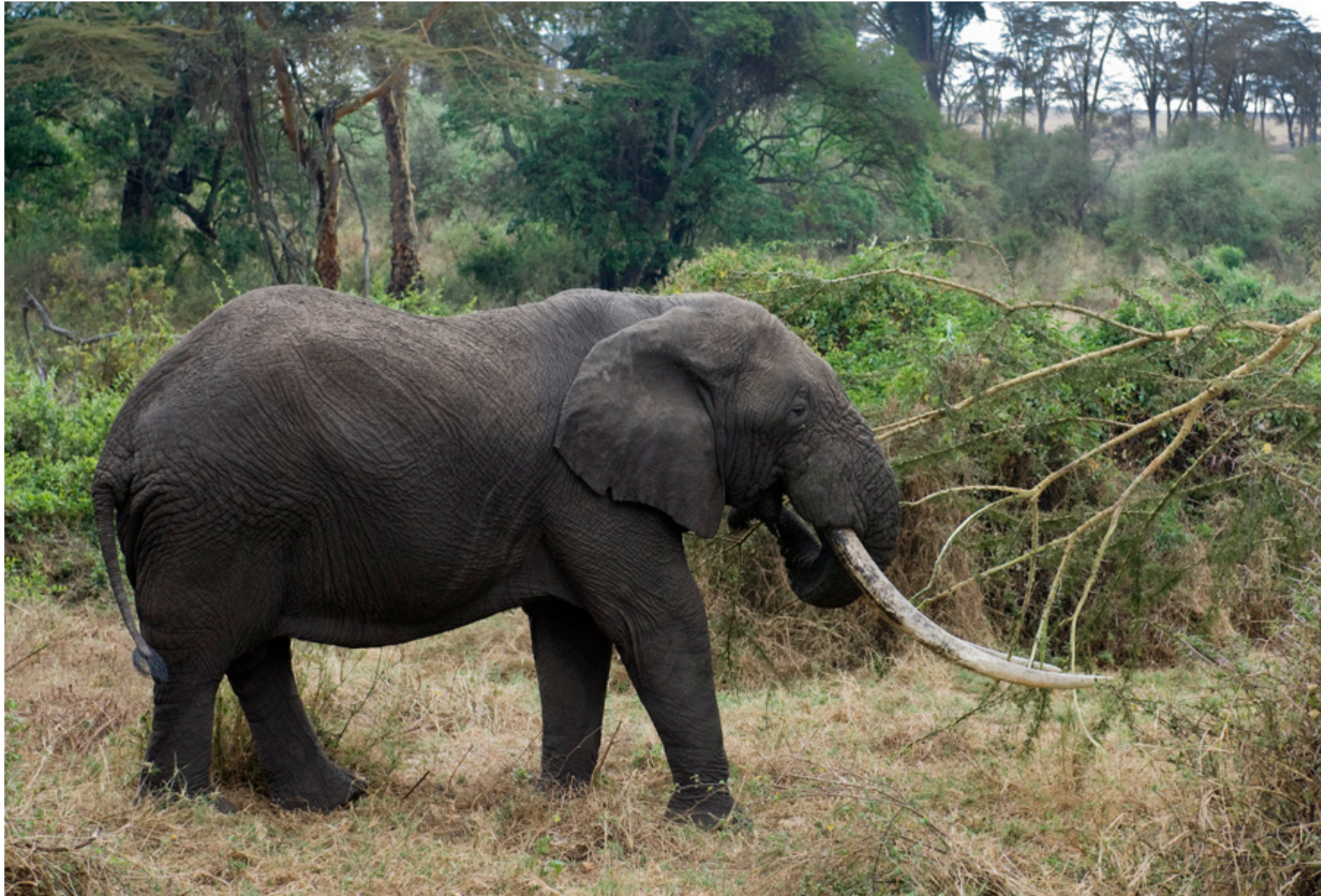
De grootste slagstanden die we deze reis hebben gezien!