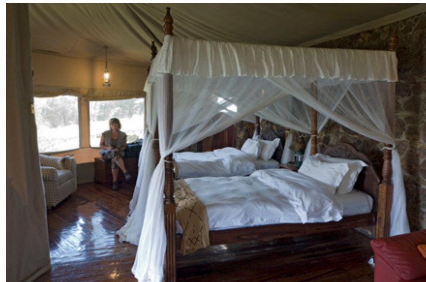
...mankeert niets aan!